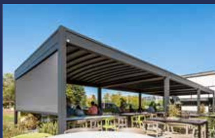
Pergola Toit Rétractable