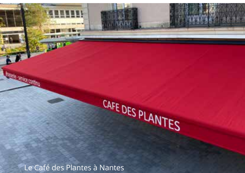
Le Café des Plantes à Nantes

Augmentez la visibilité de votre établissement avec une grande terrasse qualitative et attrayante à votre image.