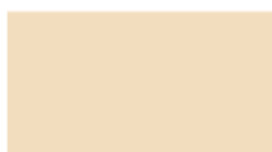
C2 RAL 1015-IVOIRE