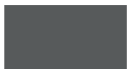
C38 RAL 7016-ANTHRACITE

D'autres coloris hors catalogue sont disponibles en option avec plus-value.